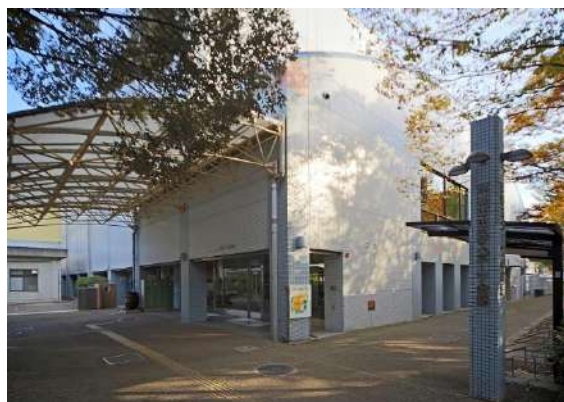
■京都市市民スポーツ会館