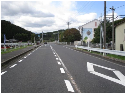
■ 倉吉市【高城小学校前】 スタート・フィニッシュ地点