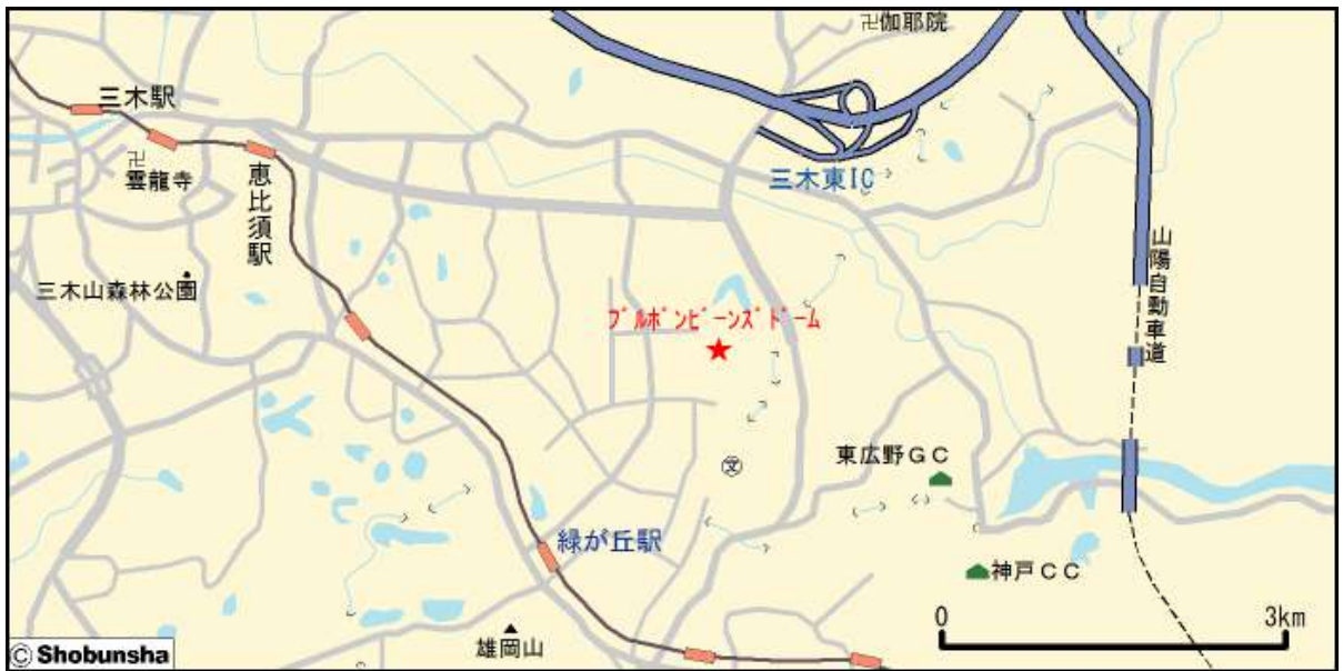
■ブルボンビーンズドーム