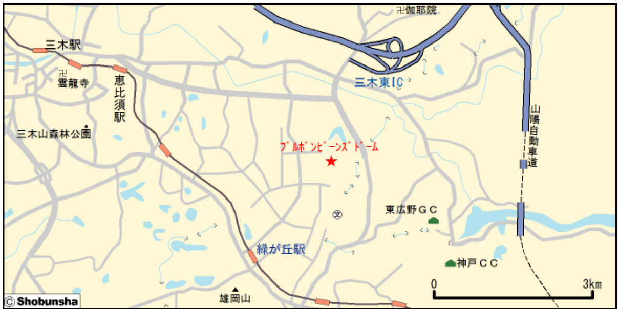
■ブルボンビーンズドーム