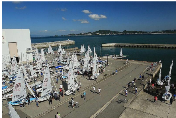
■和歌山セーリングセンター