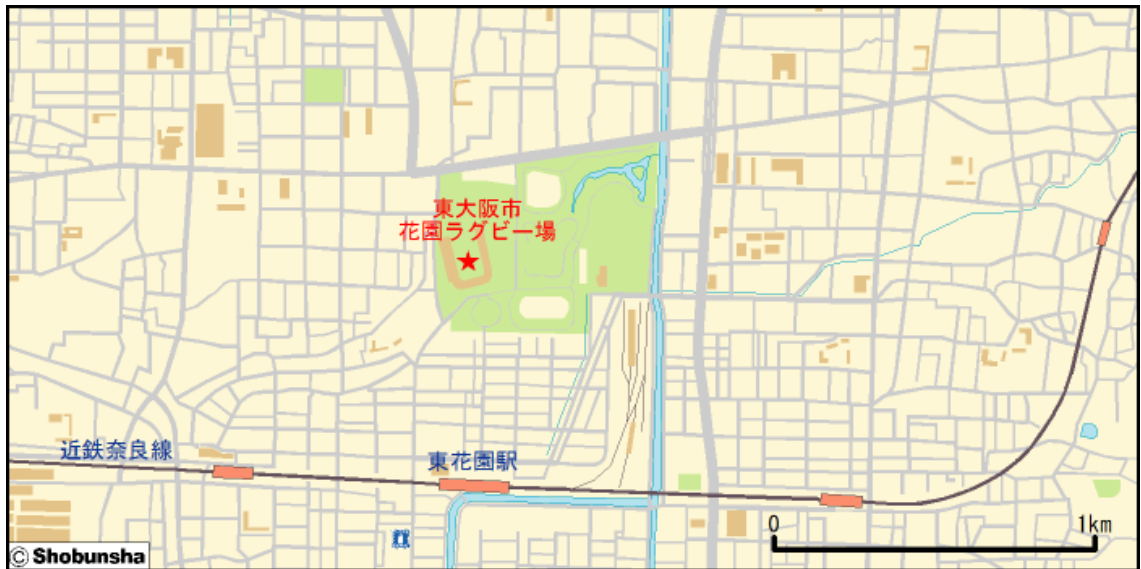
■ 東大阪市花園ラグビー場